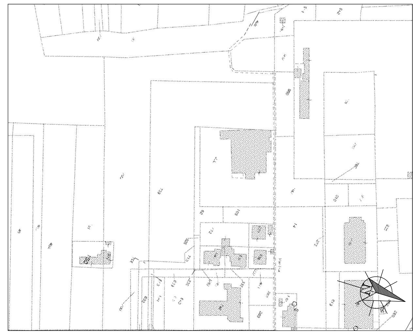
ESTRATTO CATASTALE Foglio 54 Mappale 266 Scala 1:2000